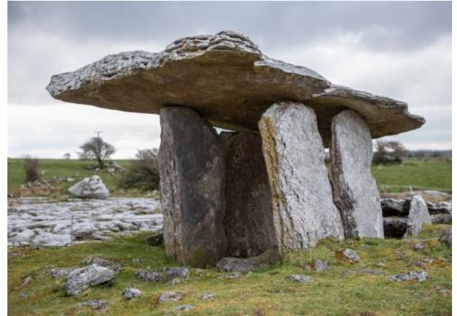
Poul nabrone Dolmen

Van 5 tot en met 10 oktober 2020 wil ik samen met andere liefhebbers Marten Toonder hun voetsporen volgen tijdens een busreis door Ierland. Ik organiseer deze reis weer in samenwerking met Historizon : een reisorganisatie die reizen organiseert op cultureel-historisch gebied.